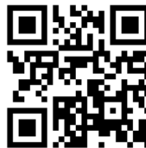
Website OMS Zeist