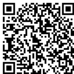
Ida van der Kooij (Contact)